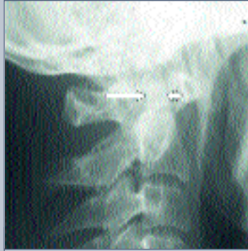
Рис. 1 Рентгенограмма в боковой проекции

Сообщаем о редком случае повреждения зуба аксиса. Пациент Ф., 42 года, получил травму при автоаварии. При поступлении предъявлял жалобы на боли в верхнешейном отделе позвоночника, усиливающиеся при небольшом движе-