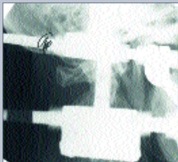
Рис. 6 Рентгенограмма в боковой проекции: устранено смещение фрагмента зуба C 2