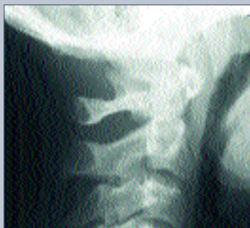
Рис. 7 Рентгенограммы C 1 —C 2 в боковой и прямой проекции: консолидация перелома зуба C 2

нии. Во время клинического осмотра: голова наклонена вперед, шейный лордоз сглажен. Резкая болезненность при пальпации на верхнешейном уровне. На рентгенограммах выявлено смещение позвонка C 1 кпереди, сустав Крювелье расширен. Контуры зуба C 2 позвонка прослеживаются нечетко и уменьшены по переднезаднему размеру. На прямой рентгенограмме – лате-