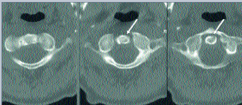
Рис. 5 КТ позвонков C 1 –C 2 . Плоскость перелома зуба в косовертикальном направлении без перехода на тело C 2