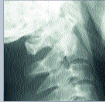
Рис. 3 Рентгенограмма в боковой проекции после вправления вытяжением на петле Глиссона