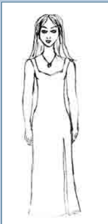
Рис. 5 Человек (женщина). Рисунок Дарьи Б., 16 лет