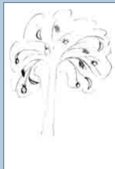
Рис. 6 Дерево. Рисунок Дарьи Б., 16 лет