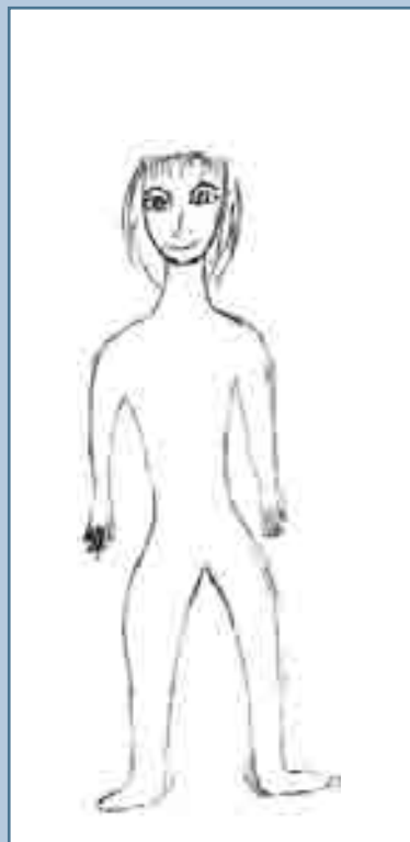
Рис. 4 Человек (женщина). Рисунок Светланы Б., 18 лет

Таким образом, для проведения эффективной комплексной реабилитационной программы для девочек-подростков, больных сколиозом, необходимо включение в нее длительного курса индивидуальной и семейной системной психотерапии.