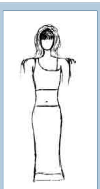
Рис. 1 Человек (женщина). Рисунок Марии Г., 15 лет

Примером затруднений в сфере контактов являются рисунки Марии Г., 15 лет (рис. 1). В рисунке человека обращают на себя внимание две особенности: отсутствие лица и рук, а также усиленный нажим и утолщенный контур фигуры. Лицо – символ сферы общения, и отсутствие черт лица может быть истолковано как тенденция