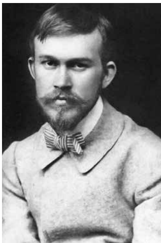
Борис Кустодиев (1903)

Два последних года обложки нашего журнала украшали картины великого русского художника Бориса Михайловича Кустодиева. Гордость российской живописи, он известен и любим во всем мире. Несомненным признанием его величайшего таланта является и то, что он, наряду с Орестом Кипренским и Иваном Айвазовским, является одним из трех русских живописцев, чьи прижизненные автопортреты были размещены в знаменитой галерее Уффици (Флоренция, Италия). Но не все знают, что его творчество и жизнь имели самое непосредственное отношение к хирургии позвоночника. Последние 15 из 49 лет жизни он был парализован, прикован к инвалидной коляске и привязан к хирургическим клиникам. И чем тяжелее были его страдания, тем веселее, ярче и солнечнее были его картины.