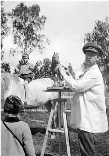
Поездка в Костромскую губернию

шению советского правительства в Россию, вместе с В.В. Крамером, одним из выдающихся советских невропатологов, и с Н.Н. Бурденко, основателем советской школы нейрохирургии и Института нейрохирургии, принимавший участие в лечении В.И. Ленина. К сожалению, операция не приводит к желаемому результату. Кустодиеву предлагают покинуть Россию, на что он отвечает: «Я русский, и как бы трудно нам всем сейчас здесь ни было, я никогда не покину свою Родину!»