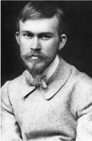
Борис Кустодиев (1903)

Два последних года обложки нашего журнала украшали картины великого русского художника Бориса Михайловича Кустодиева. Гордость российской живописи, он известен и любим во всем мире. Несомненным признанием его величайшего таланта является и то, что он, наряду с Орестом Кипренским и Иваном Айвазовским, является одним из трех русских живописцев, чьи прижизненные автопортреты были размещены в знаменитой галерее Уффици (Флоренция, Италия). Но не все знают, что его творчество и жизнь имели самое непосредственное отношение к хирургии позвоночника. Последние 15 из 49 лет жизни он был парализован, прикован к инвалидной коляске и привязан к хирургическим клиникам. И чем тяжелее были его страдания, тем веселее, ярче и солнечнее были его картины.