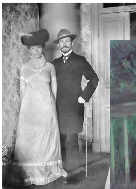
Б.М. Кустодиев с женой Юлией (1903)