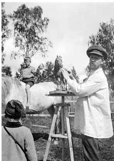
Поездка в Костромскую губернию

шению советского правительства в Россию, вместе с В.В. Крамером, одним из выдающихся советских невропатологов, и с Н.Н. Бурденко, основателем советской школы нейрохирургии и Института нейрохирургии, принимавший участие в лечении В.И. Ленина. К сожалению, операция не приводит к желаемому результату. Кустодиеву предлагают покинуть Россию, на что он отвечает: «Я русский, и как бы трудно нам всем сейчас здесь ни было, я никогда не покину свою Родину!»