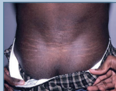
Рис. 6 Striae atrophicae [5]

ной в виде увеличения переднезаднего диаметра тел. Возможно наличие двояковогнутой деформации тел позвонков, как при несовершенном остеогенезе. Дуральные эктазии могут вызывать истончение костных стенок тел позвонков и дужек, расширение фораминальных отверстий [15]. Это обстоятельство необходимо учиты-