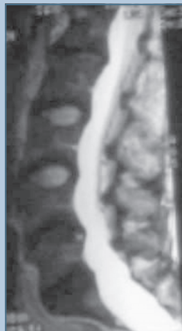
Рис. 7 МРТ при дуральной эктазии в пояснично-крестцовом отделе [5]