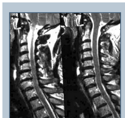
Рис. 2 Дегенеративные изменения межпозвоночных дисков в шейном отделе позвоночника

артикулярные блокады – с диагностической и лечебной (обязательное введение умеренных доз стероидов) целью, физиотерапия, массаж, психотерапия. В связи с недостаточной эффективностью консервативной терапии или кратковременностью эффекта больным была выполнена радиочастотная денервация позвоночных сегментов, которая заключалась в отдельном или комбинированном применении дерцепции межпозвоночных дисков и деструкции фасеточных нервов. Учитывая особенности